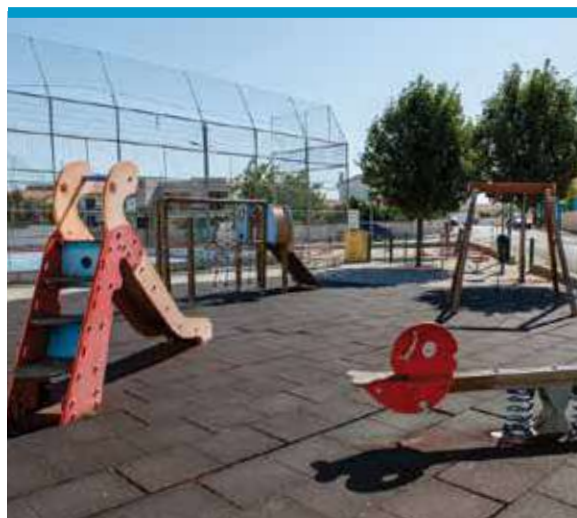
Rua do Parque