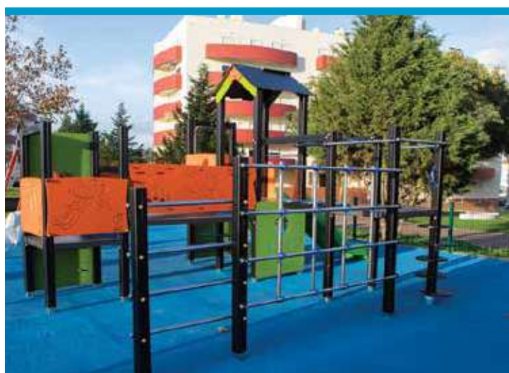
Espaço de Jogo e Recreio das Colinas do Sul