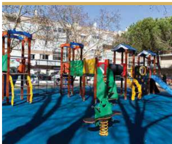
Espaço de Jogo e Recreio da Praceta de Prábis, Cruz de Pau