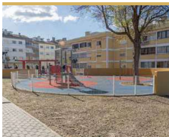
Espaço de Jogo e Recreio da Quinta do Cabral