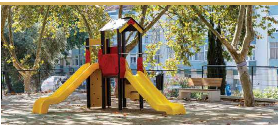
Espaço de Jogo e Recreio da Praceta Cidade de Lobito, Corroios