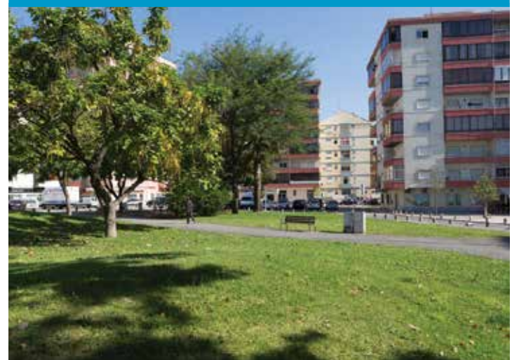
Jardim 5 de Junho II (Jardim Quinta das Paivas)