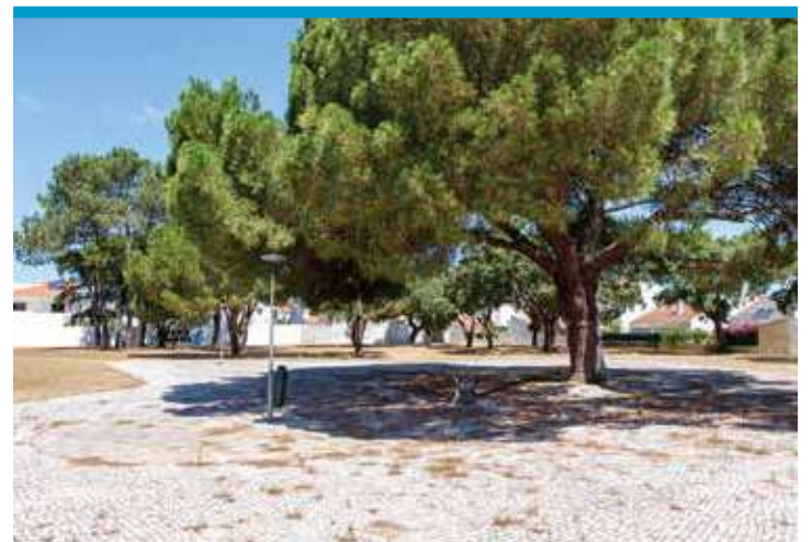
Parque da Quinta da Charnequinha, Foros de Amora