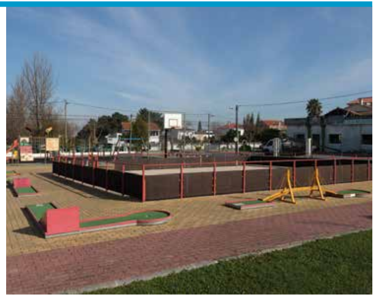
Parque Urbano dos Redondos