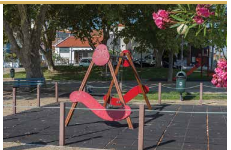
Jardim da Juventude, Casal do Marco