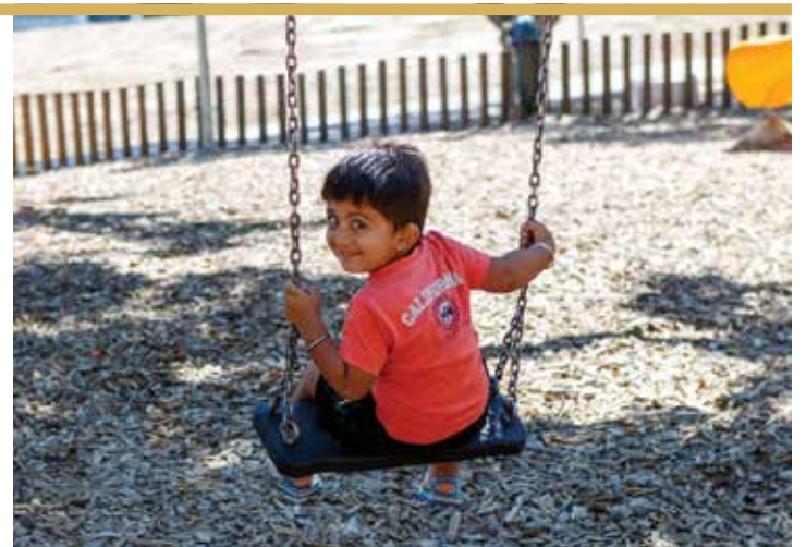
Parque Urbano de Vale de Chicharos