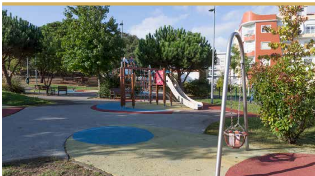
Parque Quinta D.Maria