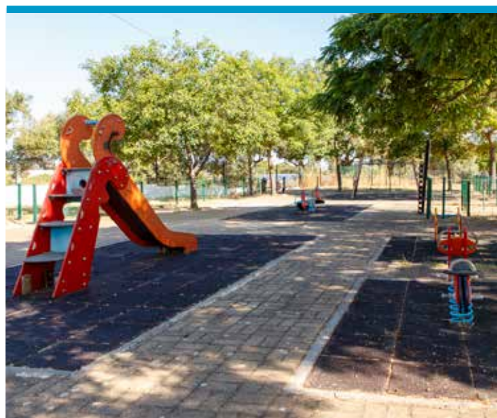
Espaço de Jogo e Recreio de Santa Teresinha