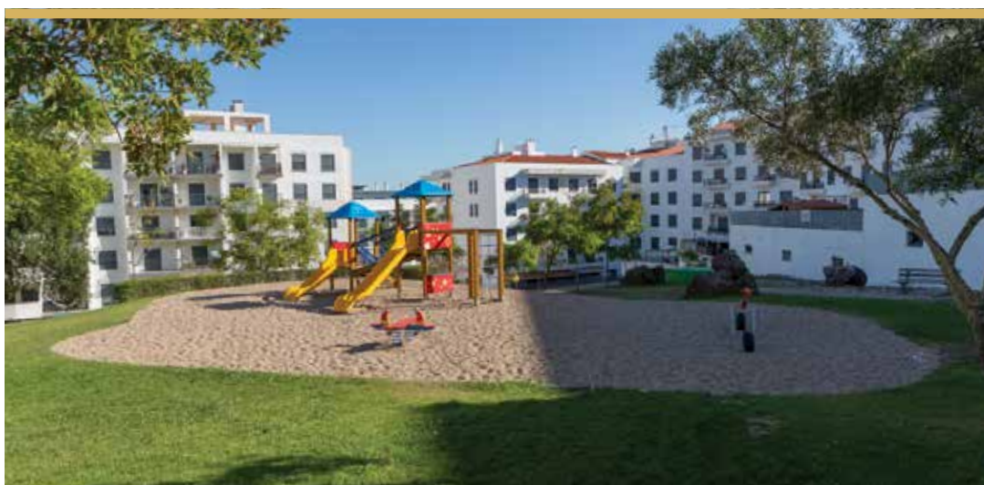
Parque Luso, Alto do Moinho