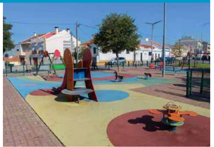
Jardim 1.º de Maio