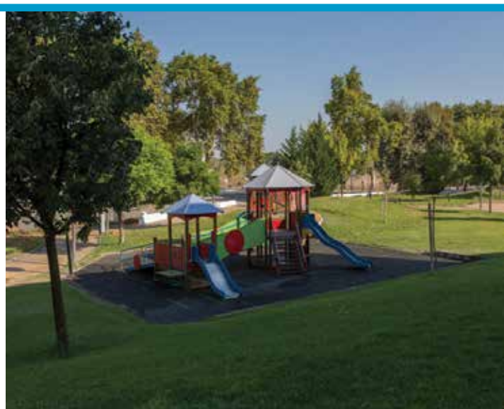
Jardim da Quinta do Mirante