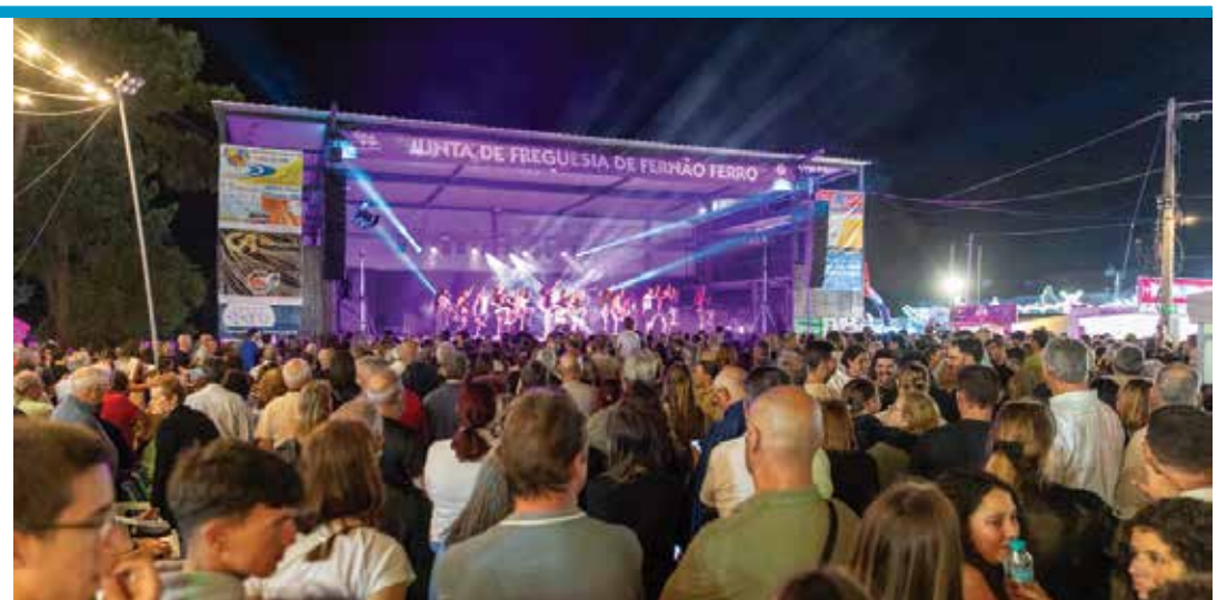
As festas populares de Fernão Ferro atraíram locais e visitantes