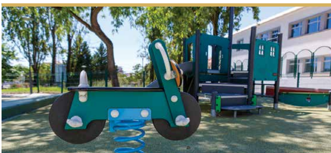
Espaço de Jogo e Recreio do Alto do Brejo