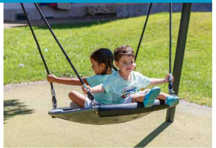
Parque dos Pioneiros, Fogueteiro