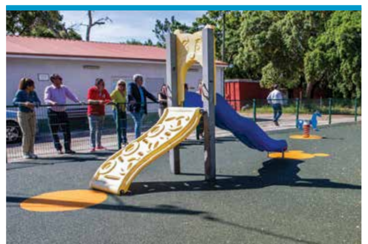
Espaço de Jogo e Recreio do Bairro 1.º de Maio