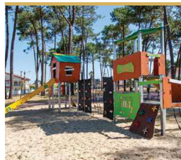
Quinta das Laranjeiras