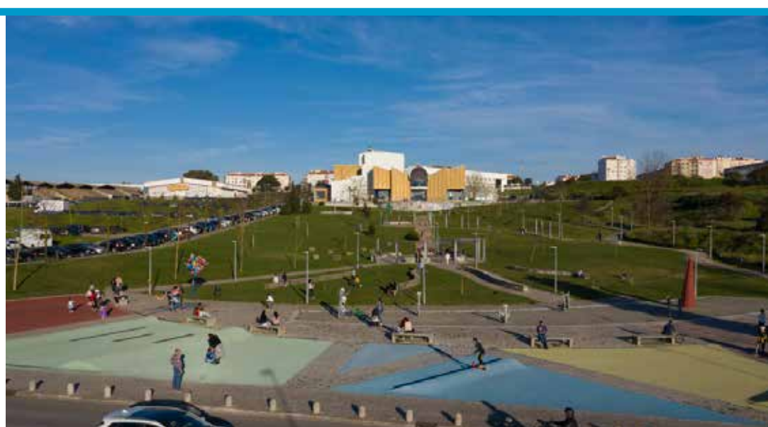
Parque da Quinta dos Franceses