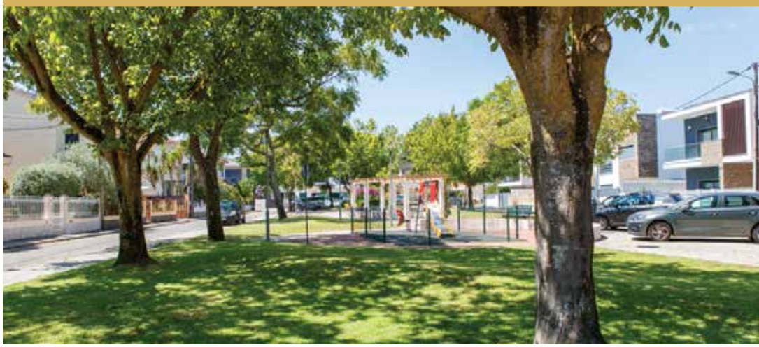
Jardim da Charnequinha, Foros de Amora