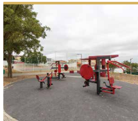
Espaço de Jogo e Recreio da Boa Hora