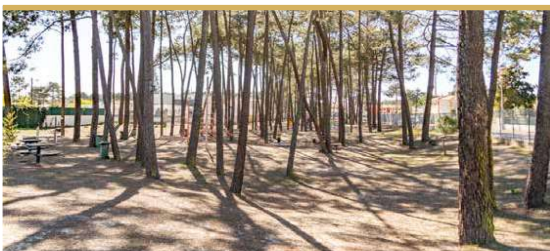
Parque Desportivo Municipal da Verdizela