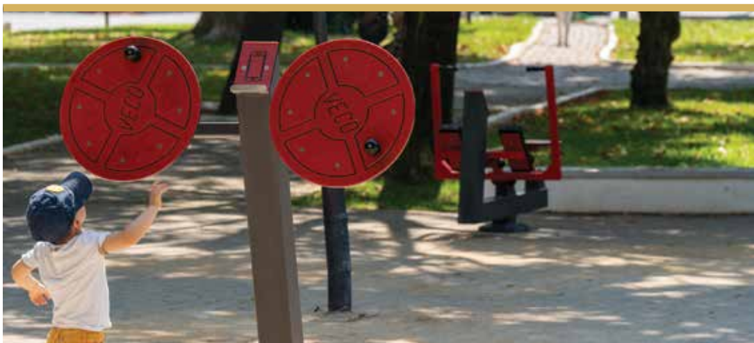
Jardim da Cordoaria