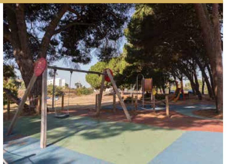
Parque da Quinta da Courela