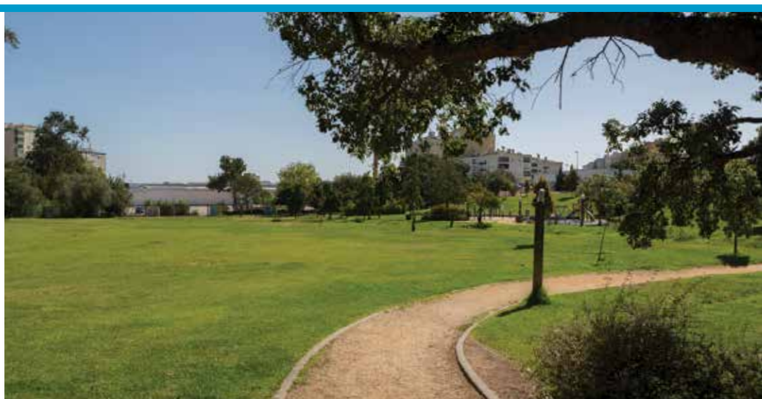
Parque Municipal do Serrado