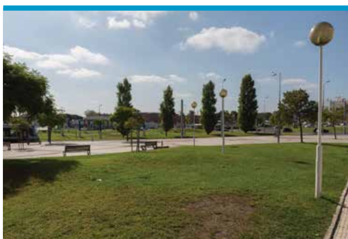
Jardim da Quinta da Água, Corroios