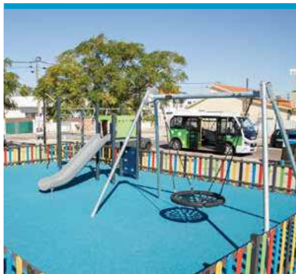
Rua João Villaret (junto ao Mercado Municipal)