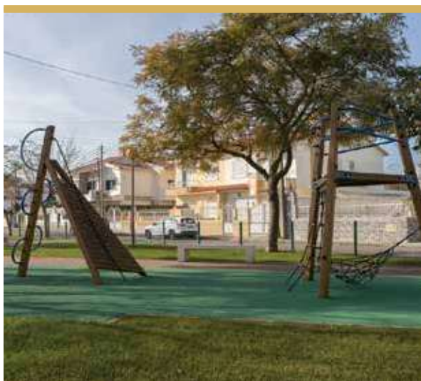
Jardim 25 de Abril