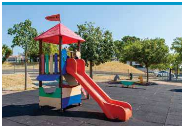
Espaço de Jogo e Recreio da Fábrica da Pólvora