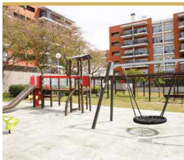
Espaço de Jogo e Recreio da Quinta do Outeiro, Arrentela