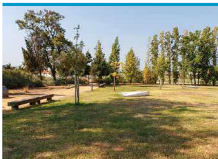
Parque Urbano de Miratejo