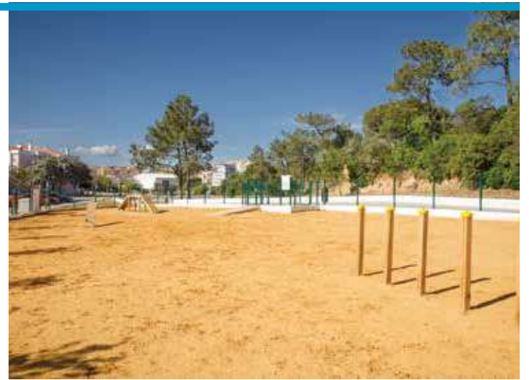
Parque Urbano da Torre da Marinha