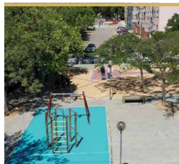
Espaço de Jogo e Recreio da Quinta das Sementes