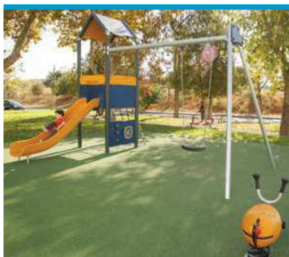
Espaço de Jogo e Recreio do Vale da Romeira