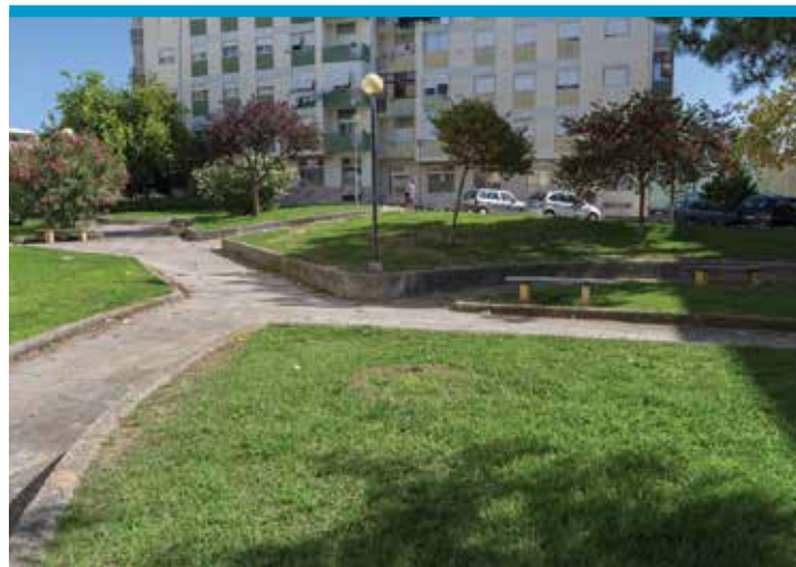
Parque da Juventude, Miratejo