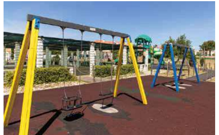
Parque Urbano de Fernão Ferro (Parque das Lagoas)