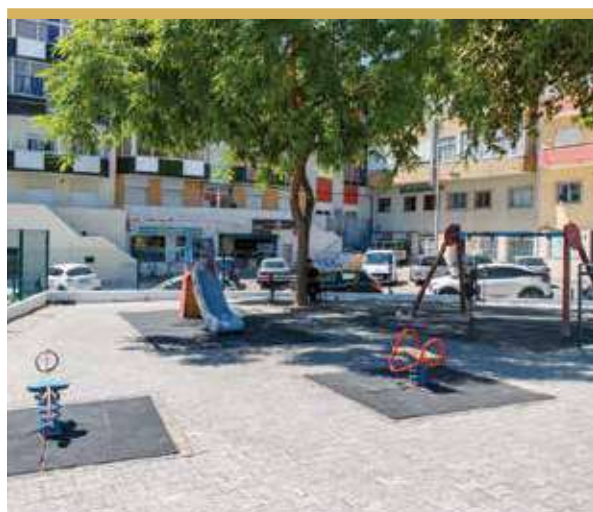
Espaço de Jogo e Recreio da Rua de Bissau, Cruz de Pau