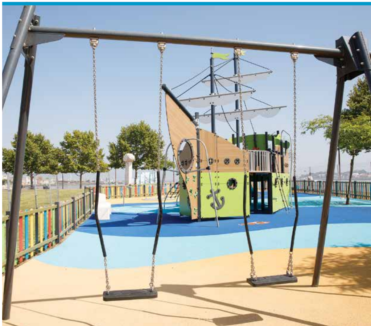
Espaço de Jogo e Recreio da Zona Ribeirinha de Amora