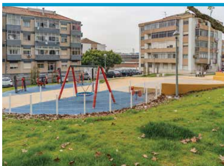
Jardim da Quinta de São Nicolau