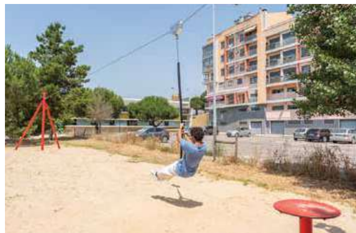
Parque Urbano da Quinta da Marialva