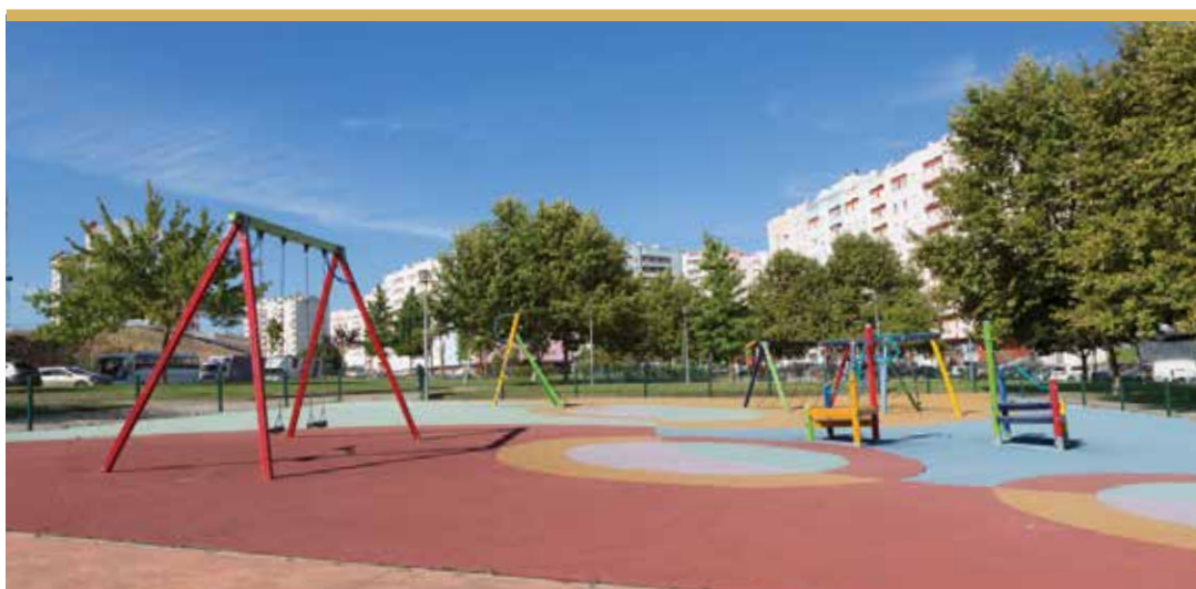
Jardim da Alameda de Santa Marta do Pinhal