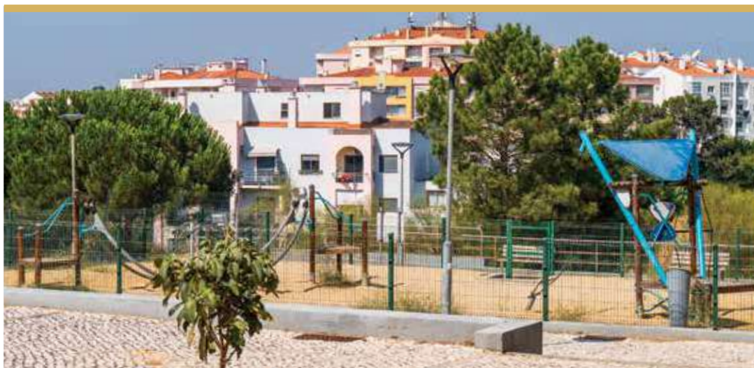
Espaço de Jogo e Recreio da Quinta da Cereira