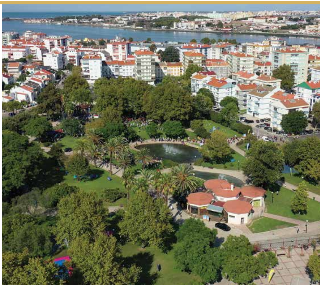
Parque Urbano das Paivas