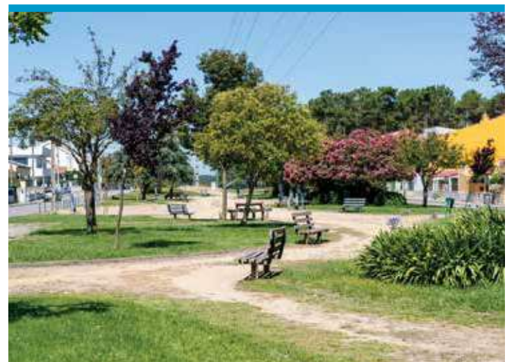
Parque da Paz, Pinhal de Frades