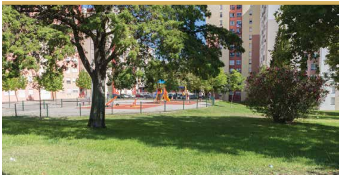
Jardim Ferreira de Castro, Miratejo