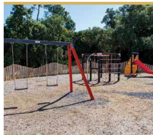
Espaço de Jogo e Recreio da Quinta de Santa Rita, Torre da Marinha