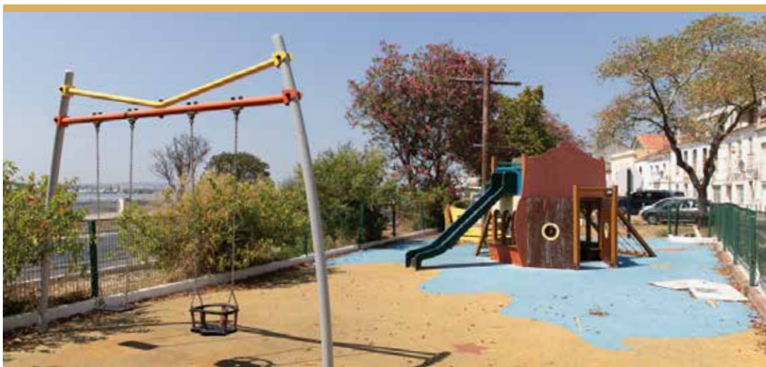
Jardim de Arrentela