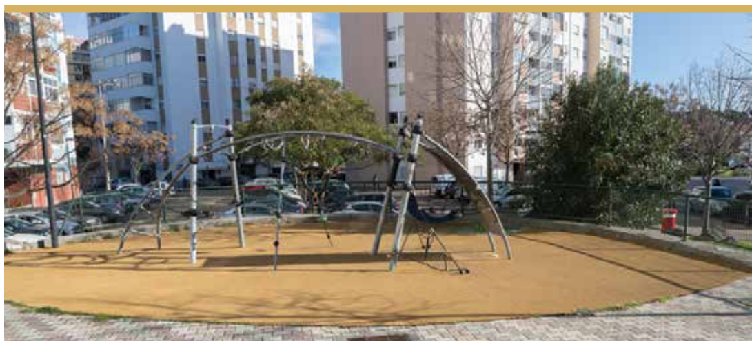
Espaço de Jogo e Recreio na Avenida Luís de Camões, Miratejo