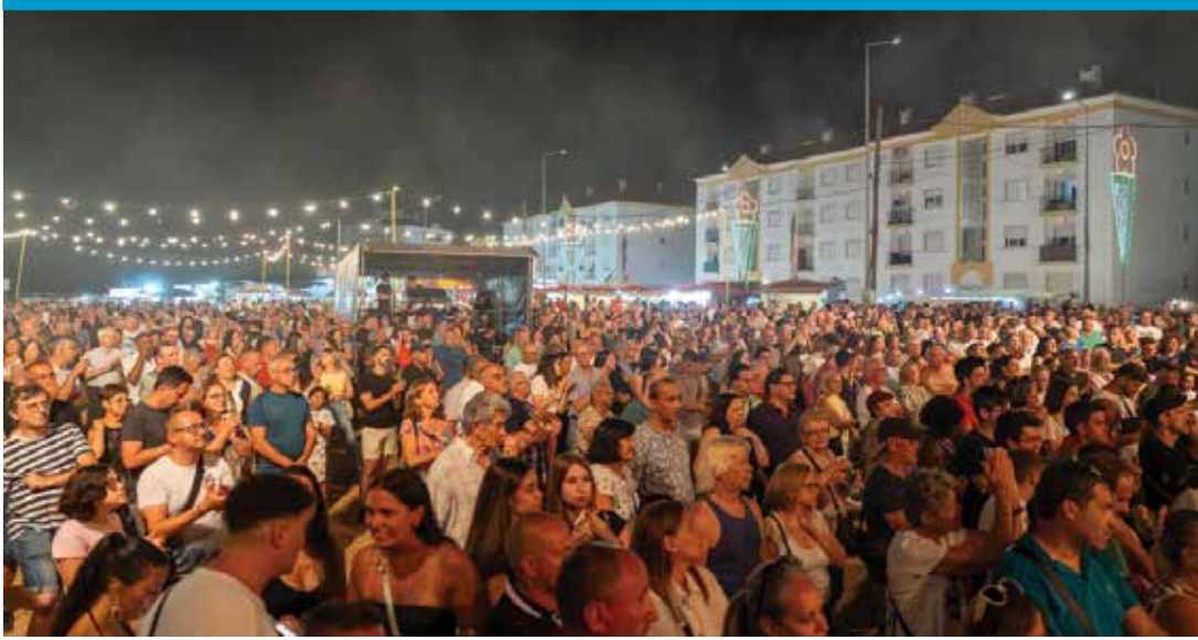
O público aderiu em força aos espetáculos