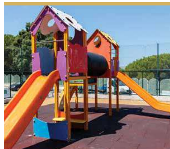
Espaço de Jogo e Recreio da Quinta da Princesa