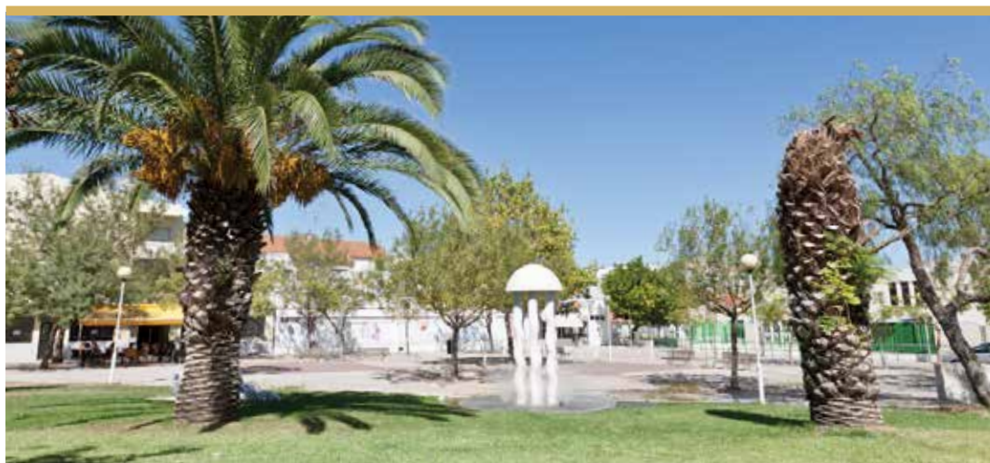
Jardim da Quinta do Campo