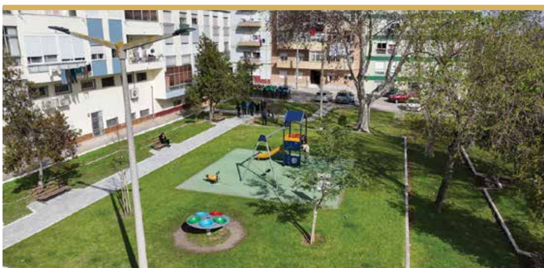
Espaço de Jogo e Recreio do Vale da Romeira