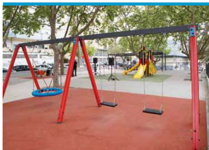
Espaço de Jogo e Recreio da Quinta de São Nicolau