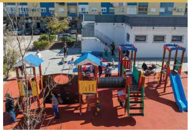
Praça Central da Torre da Marinha