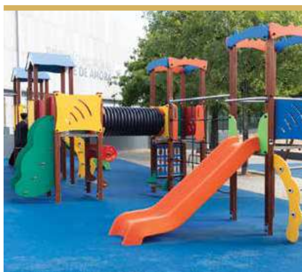
Espaço de Jogo e Recreio da Quinta do Batateiro, Cruz de Pau