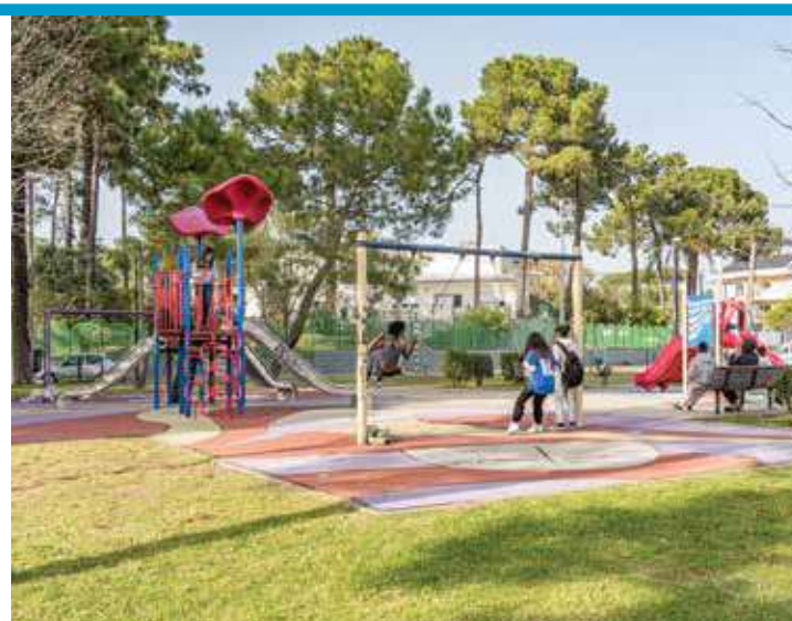
Parque José Afonso, Miratejo