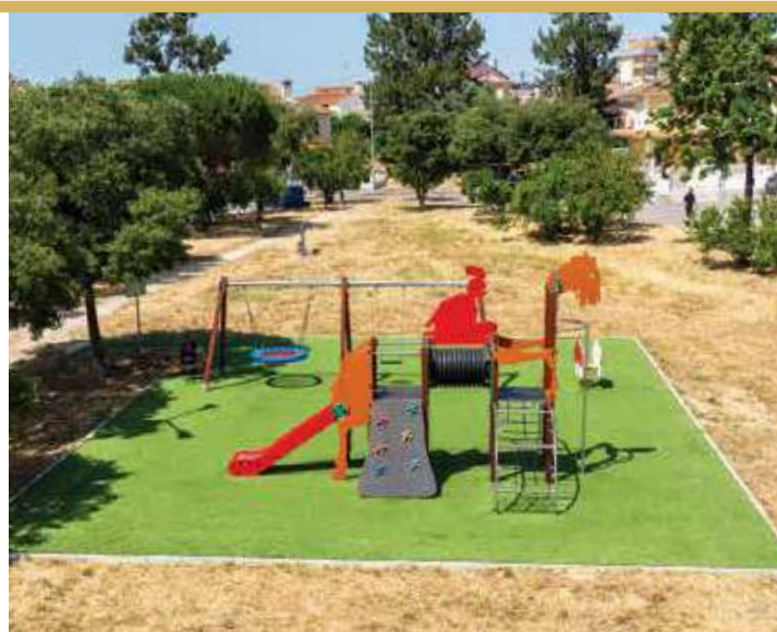
Parque de Bacelos de Gaio