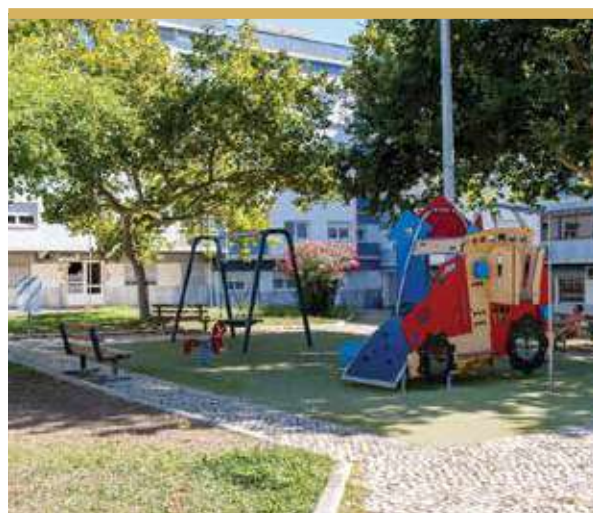
Espaço de Jogo e Recreio da Praceta Quinta de S. João