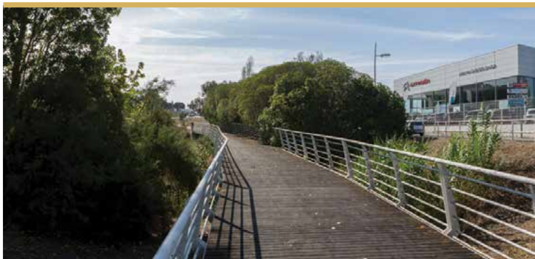
Praça do Talaminho, Santa Marta de Corroios