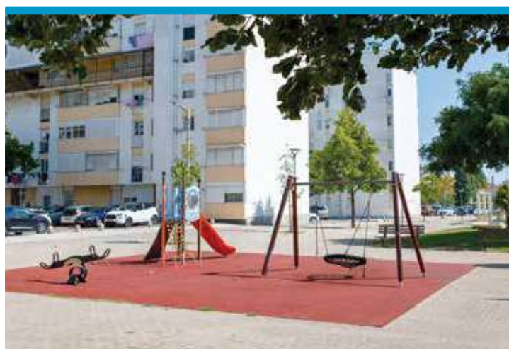
Parque Quinta da Mata