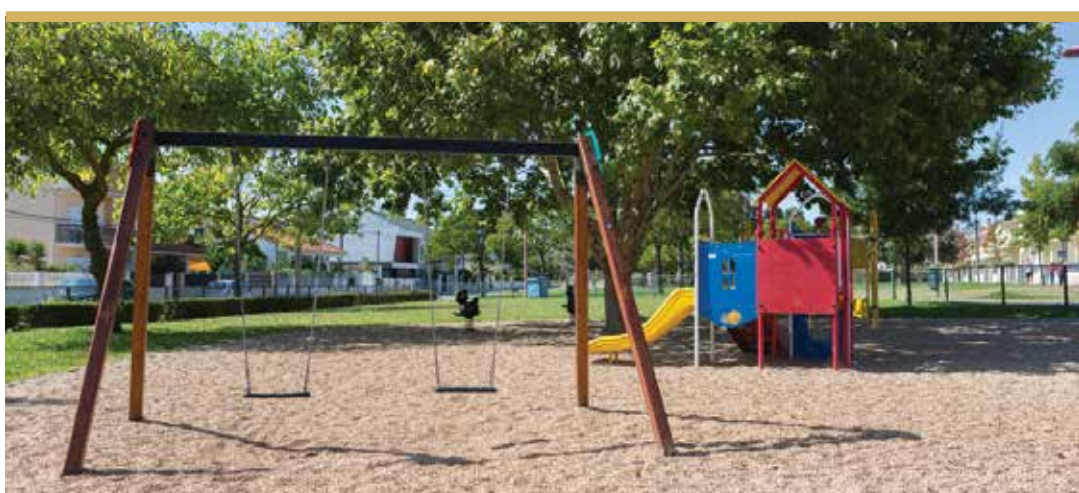
Parque da Fábrica da Pólvora, Vale de Milhaços