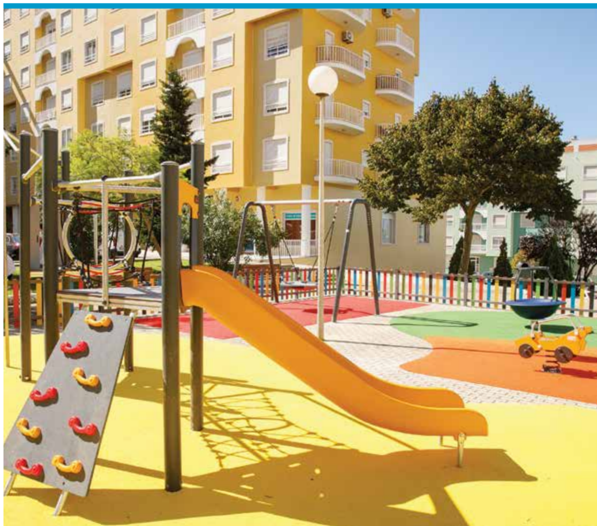
Espaço de Jogo e Recreio da Quinta da Fidalga