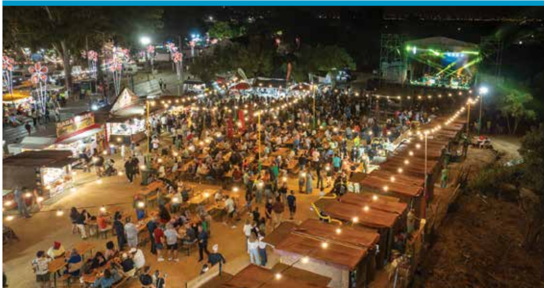
O espaço da gastronomia atraiu visitantes todos os dias