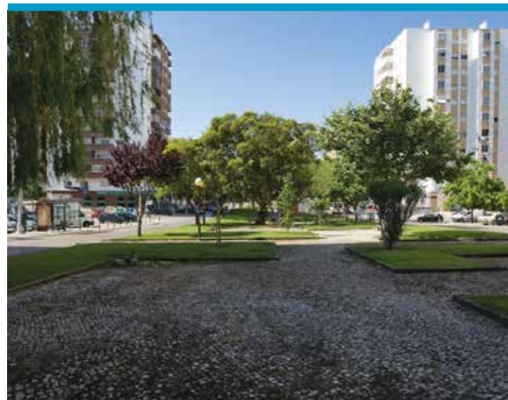
Jardim Alameda 25 de Abril, Miratejo