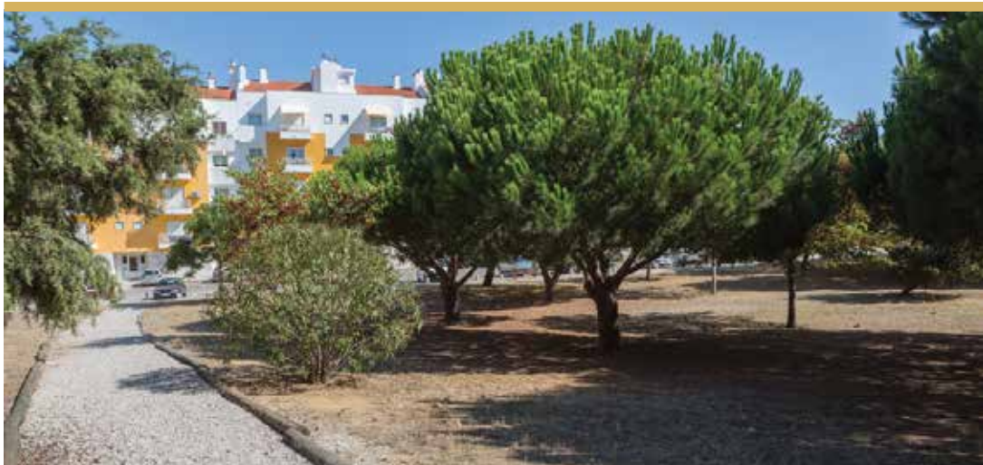
Parque da Quinta do Cruzeiro