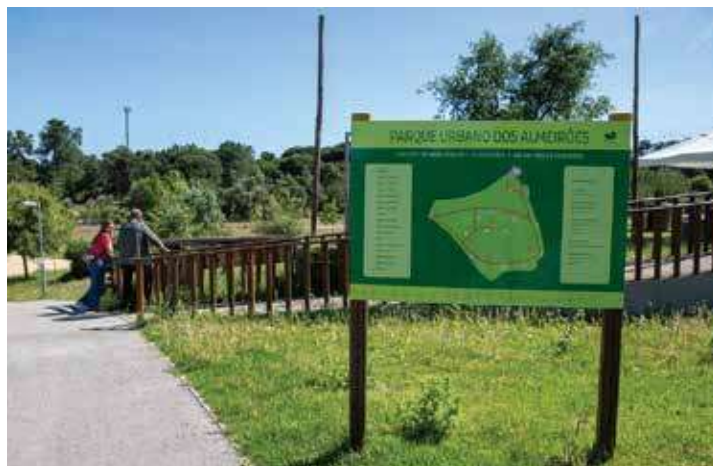
Parque Urbano dos Almeirões