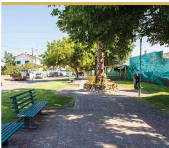
Jardim da Juventude