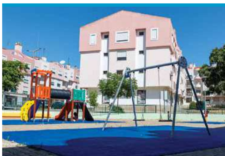
Espaço de Jogo e Recreio da Quinta da Flamândia, Casal do Marco