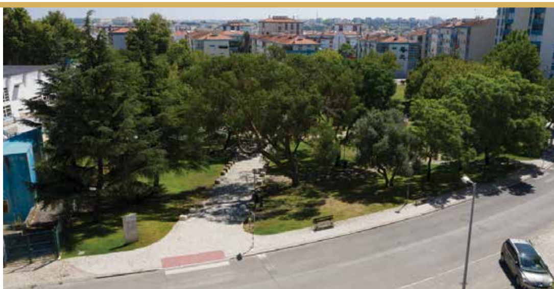
Parque das Galeguinhas/Jardim das Oliveiras