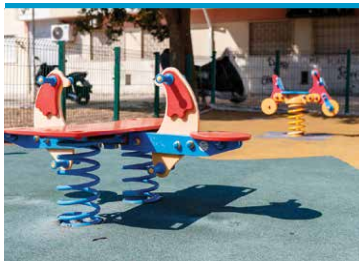
Espaço de Jogo e Recreio da Vala Real, Corroios