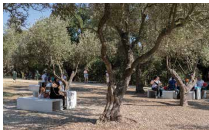
Parque Urbano do Seixal