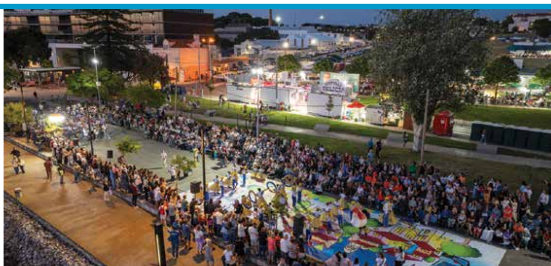
As marchas populares das escolas são sempre um momento esperado por todos