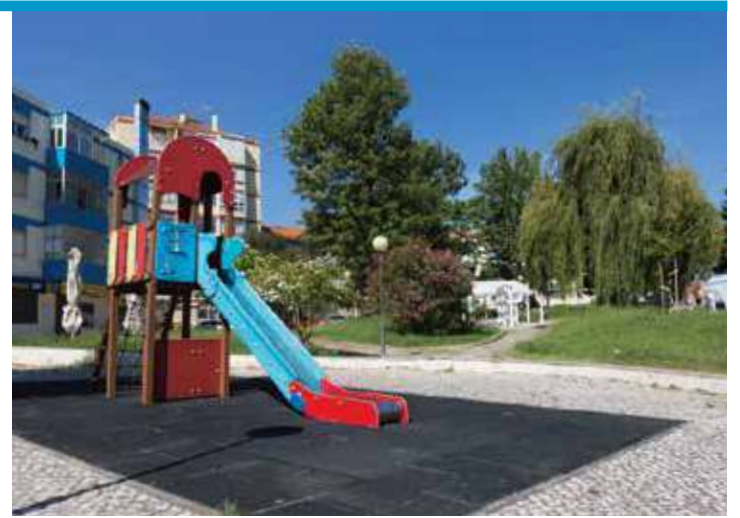
Jardim da Paz, Cruz de Pau