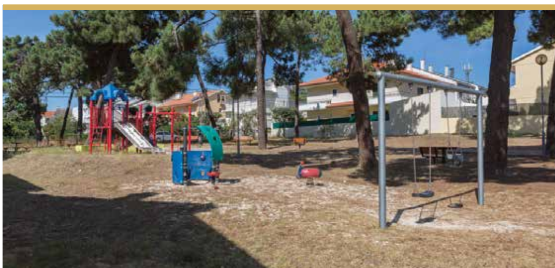
Espaço de Jogo e Recreio do Pinhal Vidal