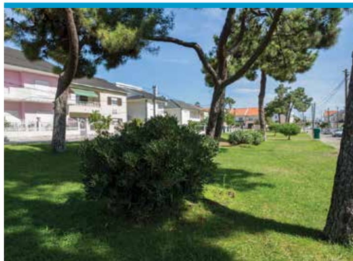
Jardim de Vale de Milhaços