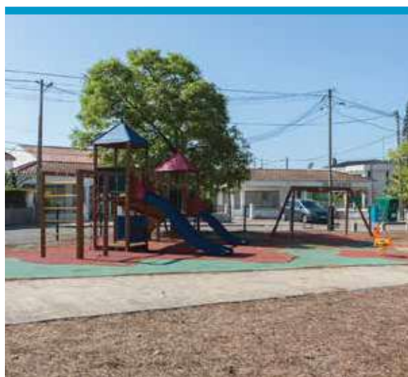
Espaço de Jogo e Recreio da Praceta dos Gladiólos, Belverde