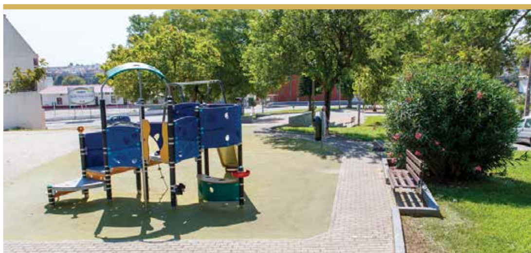
Cooperativa do Fogueteiro, Alto do Moinho