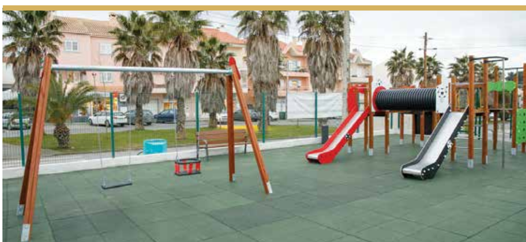
Espaço de Jogo e Recreio da Rua da Quinta da Fábrica