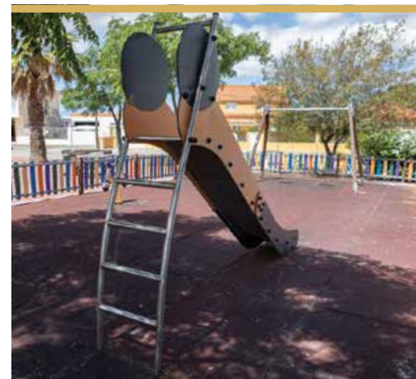
Rua Eça de Queirós