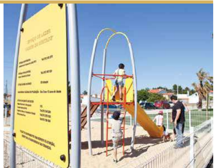
Jardim da Vontade, Pinhal do General