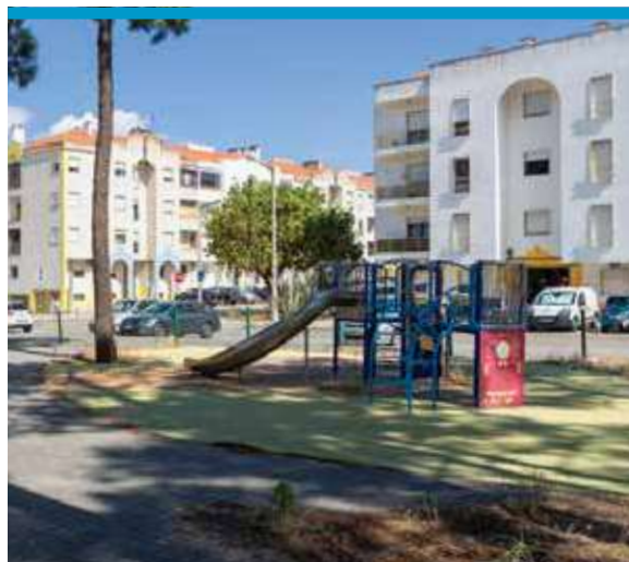
Espaço de Jogo e Recreio da Fonte da Contenda, Pinhal de Frades