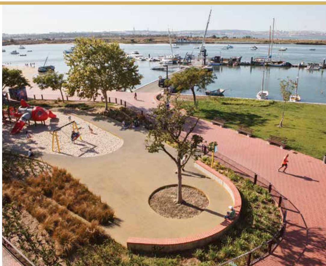
Jardim do Seixal