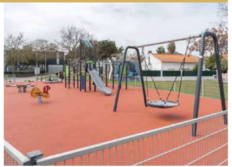
Parque Urbano do Fanqueiro