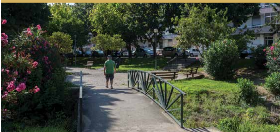
Jardim 5 de Junho (Parque da Cordoaria)