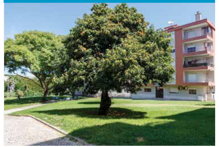
Jardim da Praça Salgueiro Maia, Fogueteiro