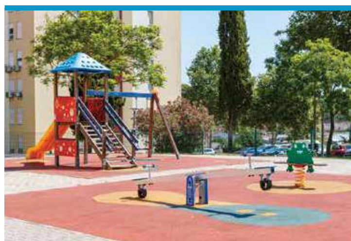
Espaço de Jogo e Recreio da Praceta Mário Sacramento