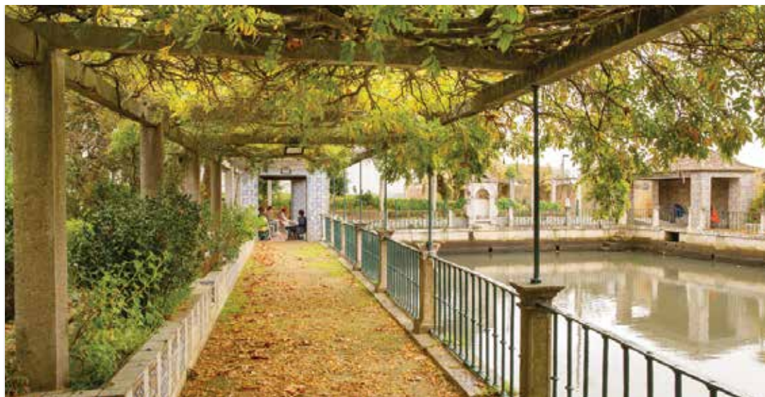
Jardim da Quinta da Fidalga