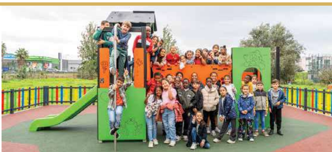
Parque Infantil da Unidade, Casal do Marco