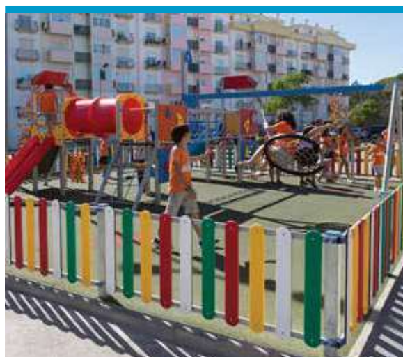
Espaço de Jogo e Recreio de Vale de Gatos, Foros de Amora