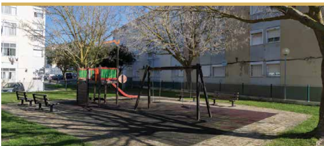
Espaço de Jogo e Recreio das Cavaquinhas