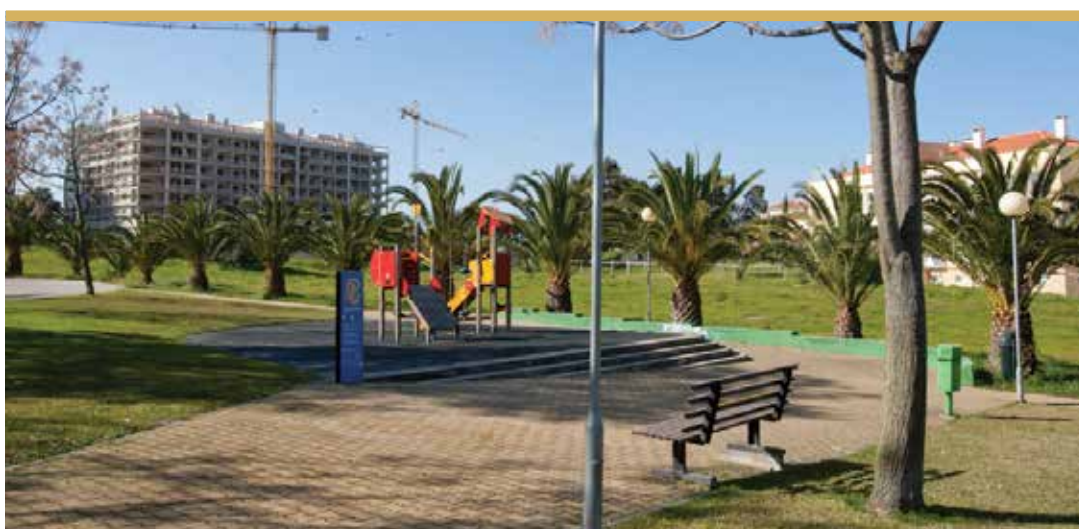
Espaço de Jogo e Recreio da Quinta da Cabrinha