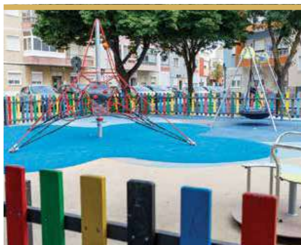
Espaço de Jogo e Recreio Bento Jesus Caraça, Amora