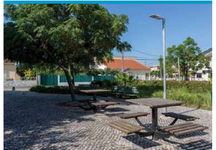
Jardim dos Foros de Amora