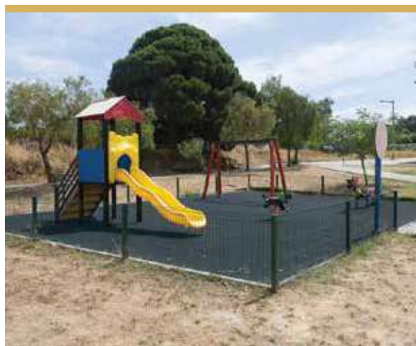
Espaço de Jogo e Recreio da Quinta do Lirio