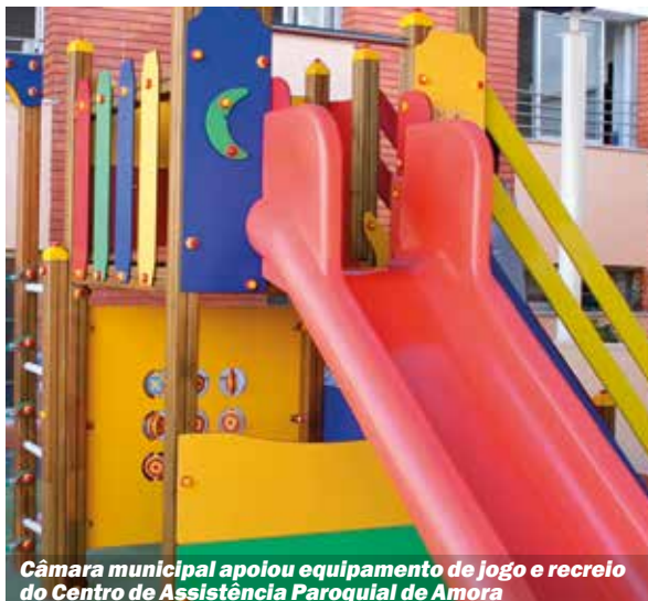
Câmara municipal apoiou equipamento de jogo e recreio do Centro de Assistência Paroquial de Amora