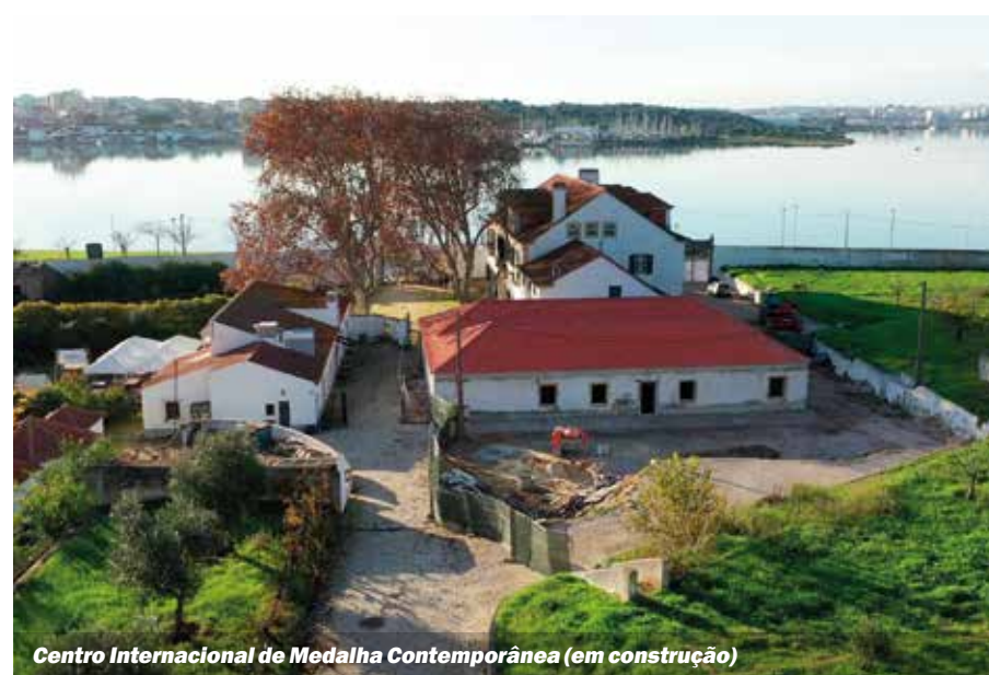
Centro Internacional de Medalha Contemporânea (em construção)