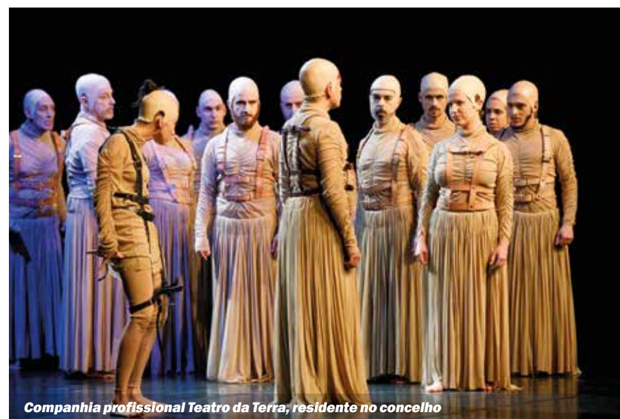
Companhia Profissional Teatro da Terra, residente no concelho