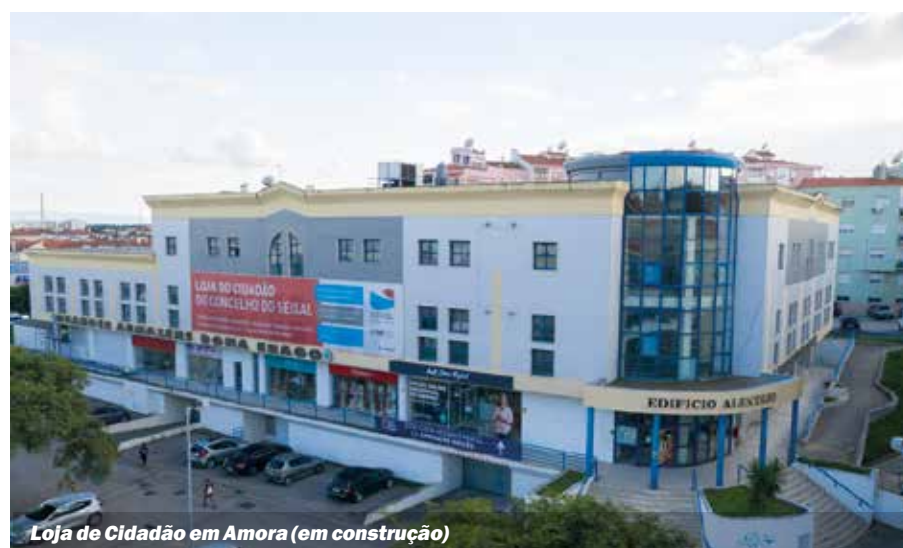
Loja de Cidadão em Amora (em construção)