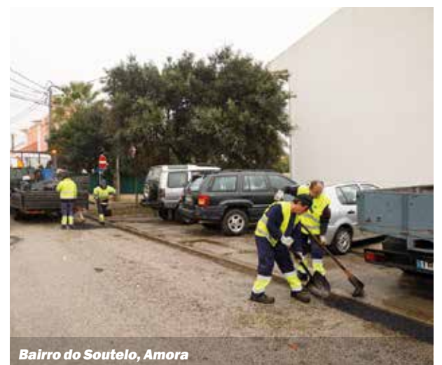
Bairro do Soutelo, Amora