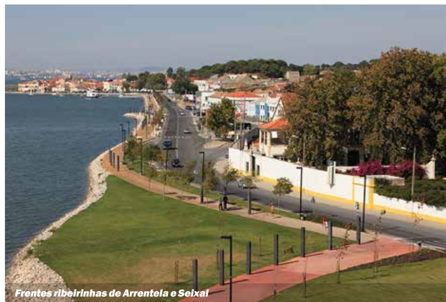
Frentes ribeirinhas de Arrentela e Seixal