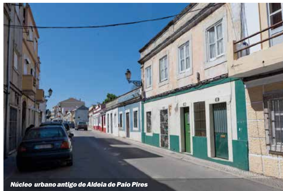
Núcleo urbano antigo de Aldeia de Paio Pires