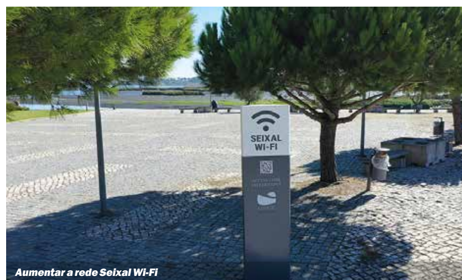
Aumentar a rede Seixal Wi-Fi