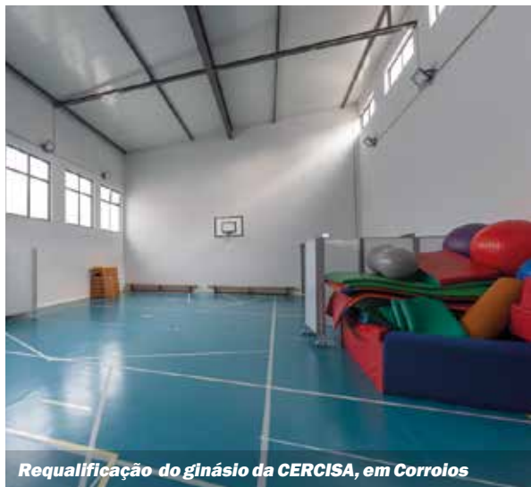
Requalificação do ginásio da CERCISA, em Corroios