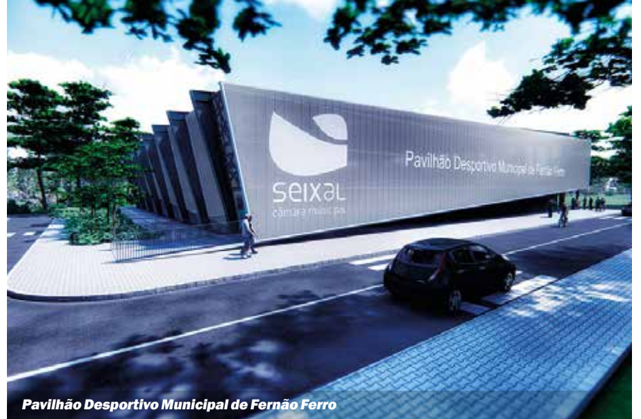
Pavilhão Desportivo Municipal de Fernão Ferro