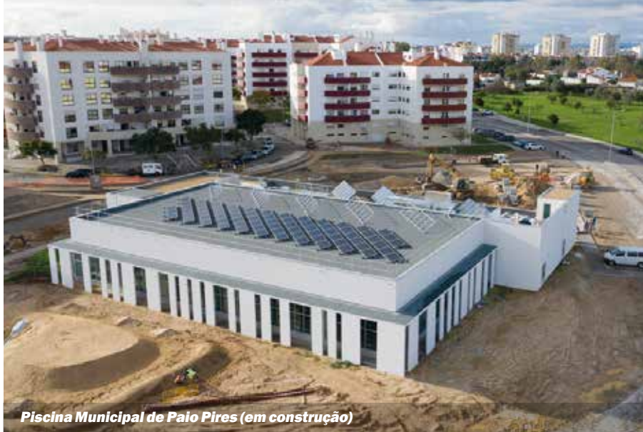
Piscina Municipal de Paio Pires (em construção)