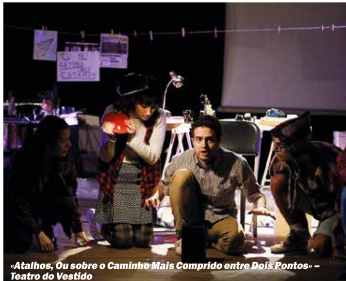
«Atalhos, Ou sobre o Caminho Mais Comprido entre Dois Pontos» – Teatro do Vestido