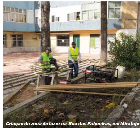
Criação de zona de lazer na Rua das Palmeiras, em Miratejo