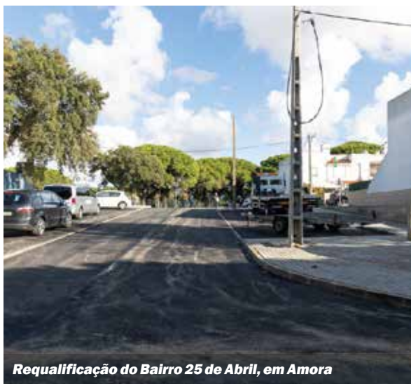
Requalificação do Bairro 25 de Abril, em Amora