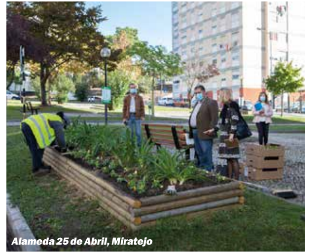
Alameda 25 de Abril, Miratejo