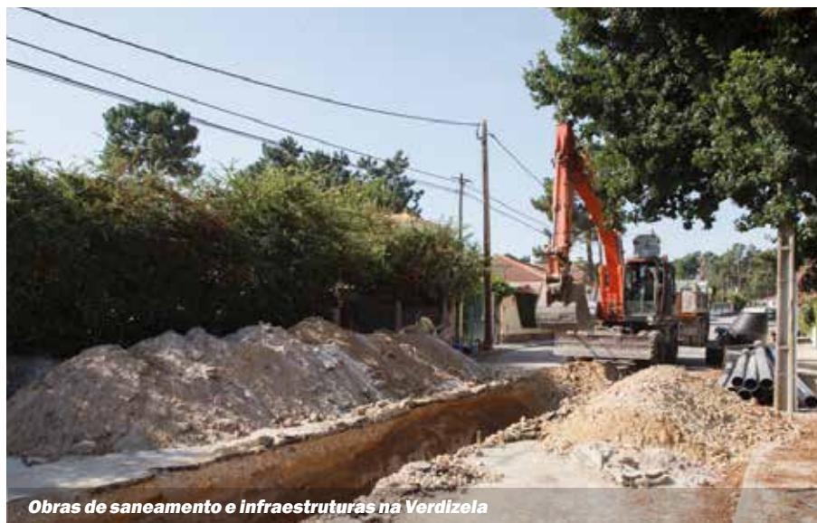
Obras de saneamento e infraestruturas na Verdizela