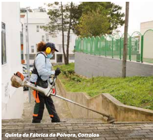
Quinta da Fábrica da Pólvora, Corrolos