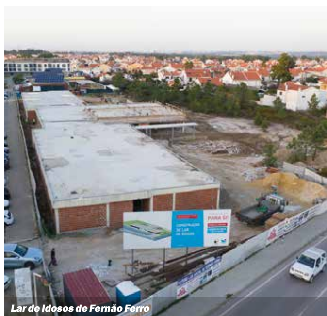
Lar de Idosos de Fernão Ferro