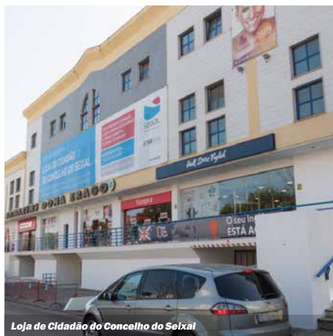
Loja de Cidadão do Concelho do Seixal