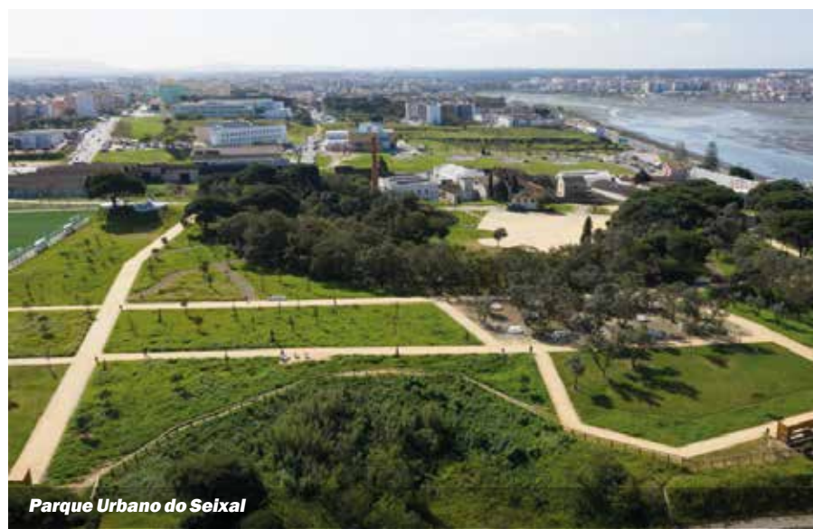
Parque Urbano do Seixal