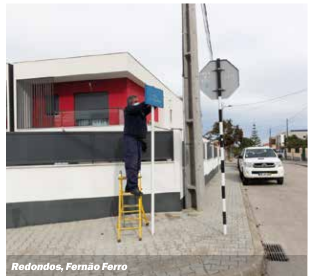
Redondos, Fernão Ferro