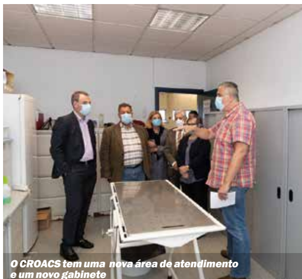
O CROACS tem uma nova área de atendimento e um novo gabinete