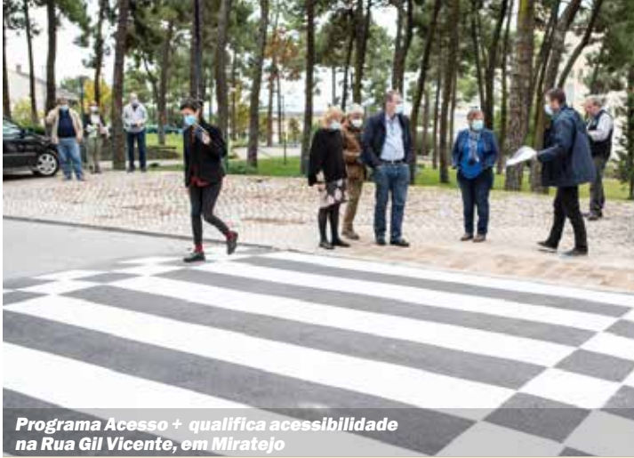
Programa Acesso + qualifica acessibilidade na Rua Gil Vicente, em Miratejo