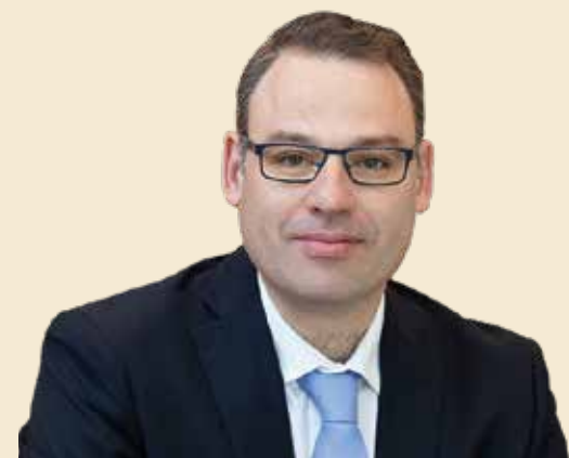
Joaquim Santos Presidente da Câmara

«Concelho do Seixal, uma terra onde é bom viver» é o lema do 184.º aniversário do concelho. Devido à situação pandémica, a sessão solene, ponto alto da celebração, foi adiada. Com esta cerimónia homenageamos os nossos trabalhadores que diariamente asseguram o bem-estar coletivo, distinguimos cidadãos do tecido empresarial local, figuras da cultura, do desporto e ex-autarcas. Todos os que contribuíram para fortalecer o desenvolvimento democrático, económico, cultural e social do concelho e o serviço público prestado à população. Acreditamos que o trabalho conjunto e o esforço de todos são determinantes para a concretização do projeto que temos para esta terra.