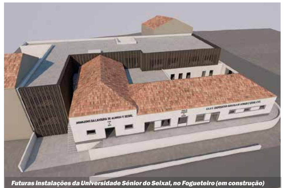
Futuras instalações da Universidade Sénior do Seixal, no Fogueteiro (em construção)