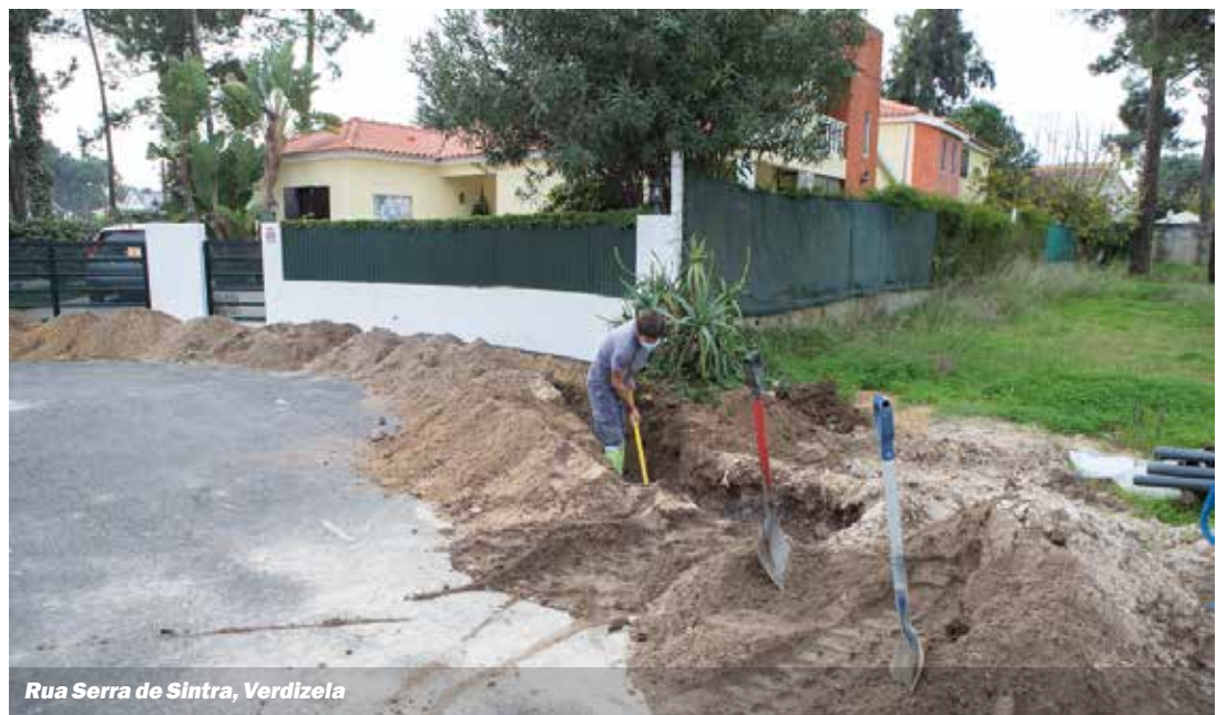
Rua Serra de Sintra, Verdizela