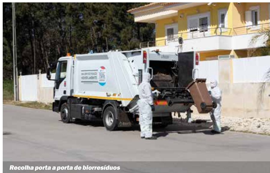
Recolha porta a porta de biorresíduos