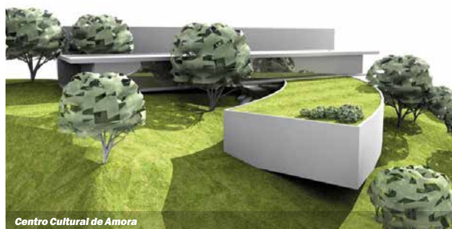
Centro Cultural de Amora