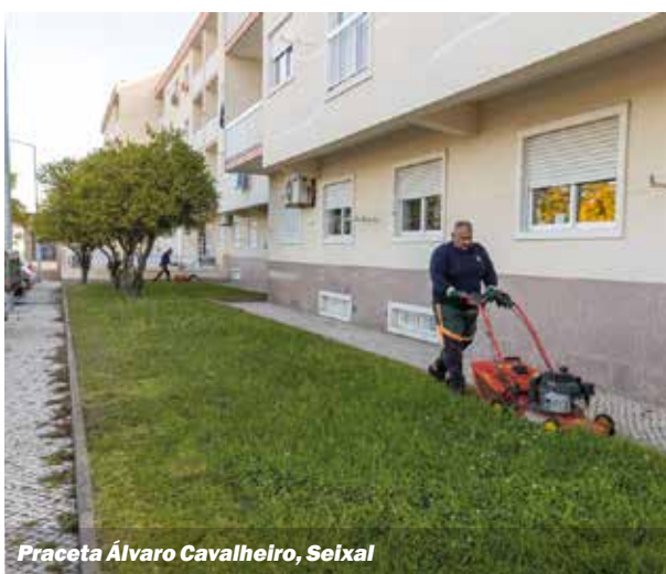
Praceta Álvaro Cavalheiro, Seixal