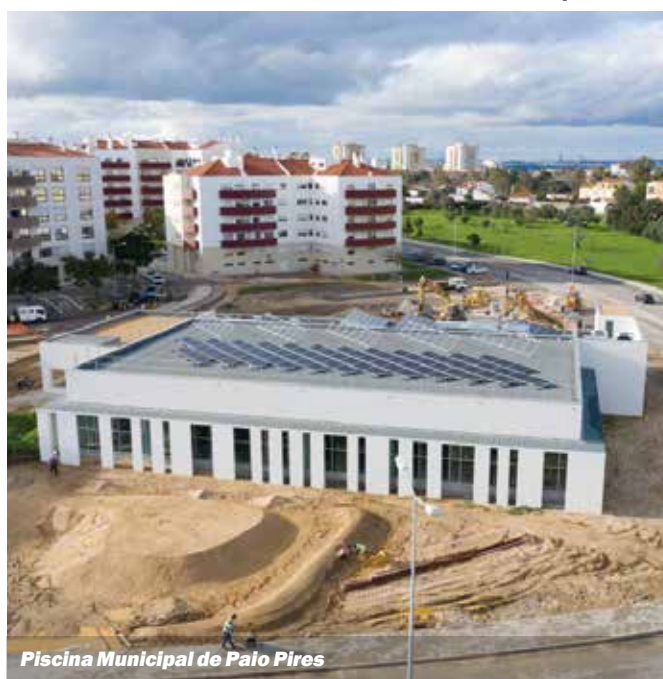
Piscina Municipal de Palo Pires