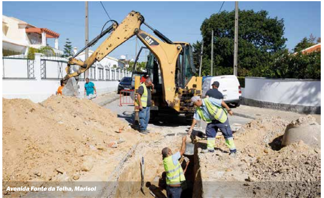
Avenida Fonte da Telha, Marisol