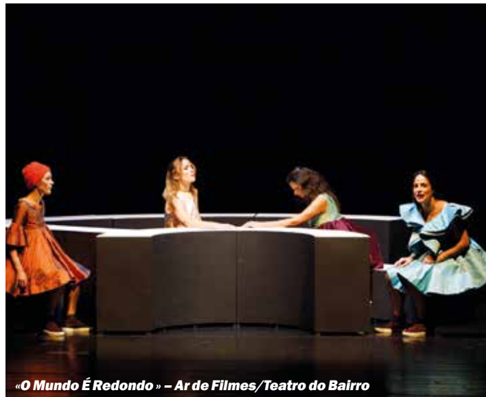
«O Mundo É Redondo» – Ar de Filmes/Teatro do Bairro