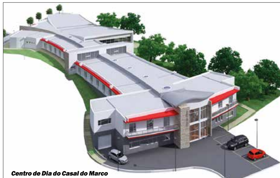
Centro de Dia do Casal do Marco