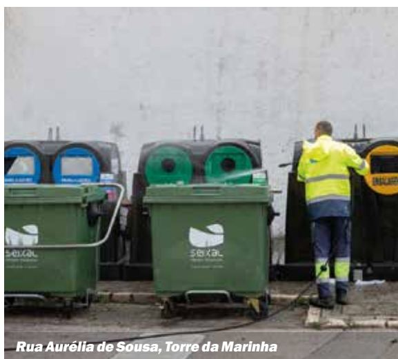
Rua Aurélio de Sousa, Torre da Marinha