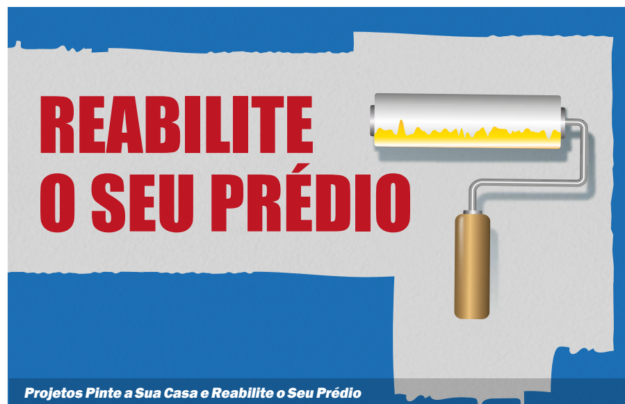
Projetos Pinte a Sua Casa e Reabilite o Seu Prédio