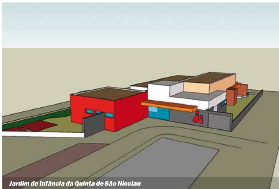
Jardim de Infância da Quinta de São Nicolau