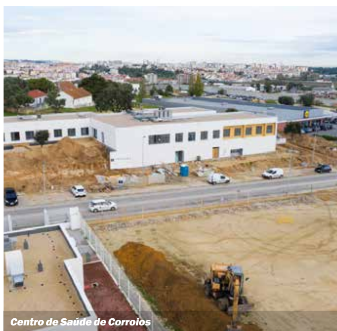
Centro de Saúde de Corroios