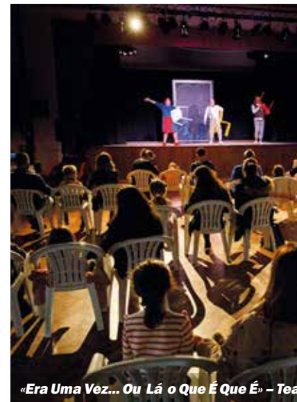
«Era Uma Vez... Ou Lá o Que É Que É» – Teatro do Bairro