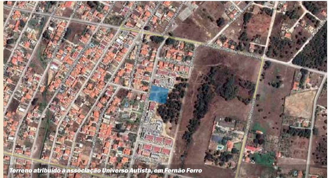
Terreno atribuído à associação Universo Autista, em Fernão Ferro

As deliberações são publicadas na íntegra nas atas das reuniões, as quais podem ser consultadas em cm-seixal.pt .