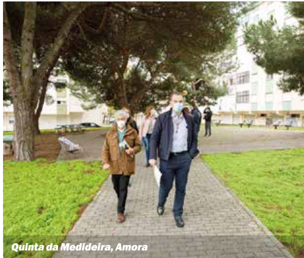
Quinta da Medideira, Amora

As zonas onde decorreu o Seixal + Perto nos meses de outubro e novembro foram a Quinta da Fábrica da Pólvora, Torre da Marinha, Miratejo, Seixal, Bairro do Soutelo, Redondos e Quinta da Medideira.