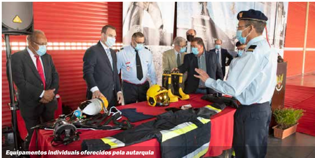
Equipamentos individuais oferecidos pela autarquia

Associação Humanitária de Bombeiros Mistos do Concelho do Seixal