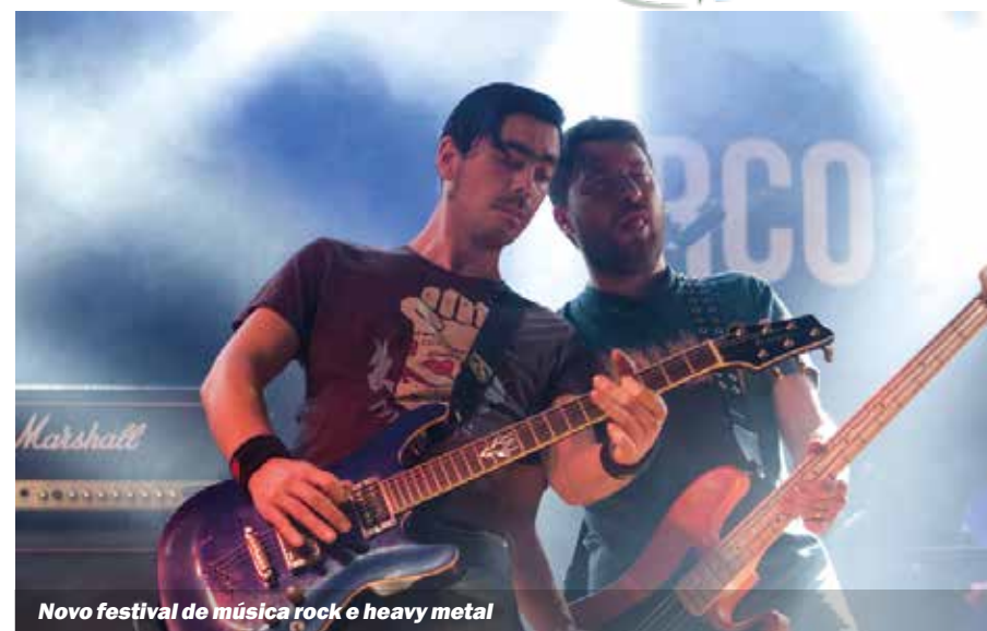
Novo festival de música rock e heavy metal