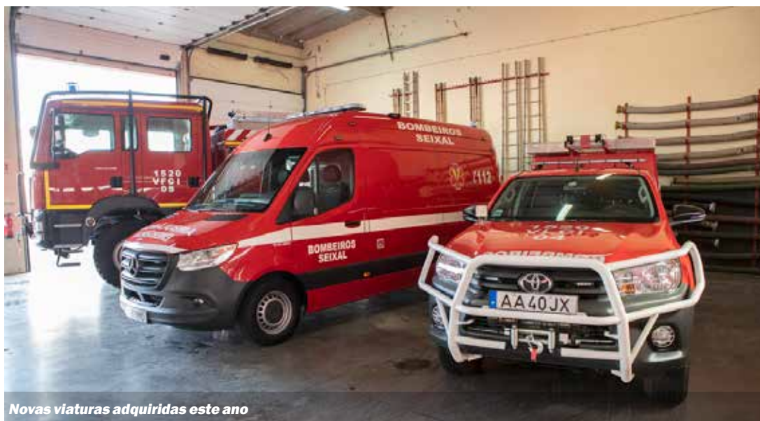
Novas viaturas adquiridas este ano

bate a incêndios atribuída num sorteio promovido pela Liga de Bombeiros Portugueses em parceria com a TVI e a Calzedonia; uma ambulância oferecida pela Câmara Municipal do Seixal por ocasião da celebração do 25 de Abril e um veículo florestal de combate a incêndios entregue à corporação em outubro, com-