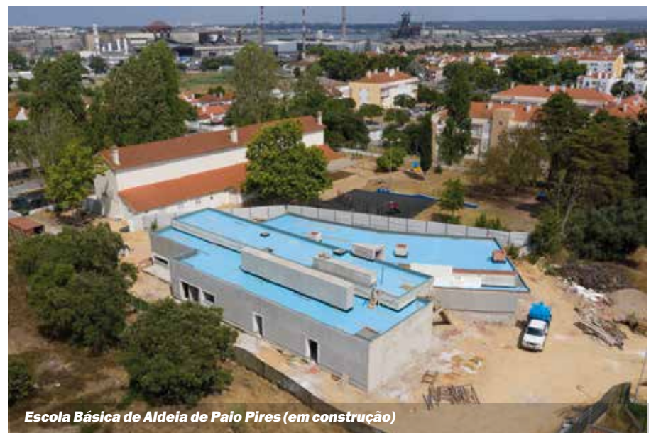
Escola Básica de Aldeia de Paio Pires (em construção)