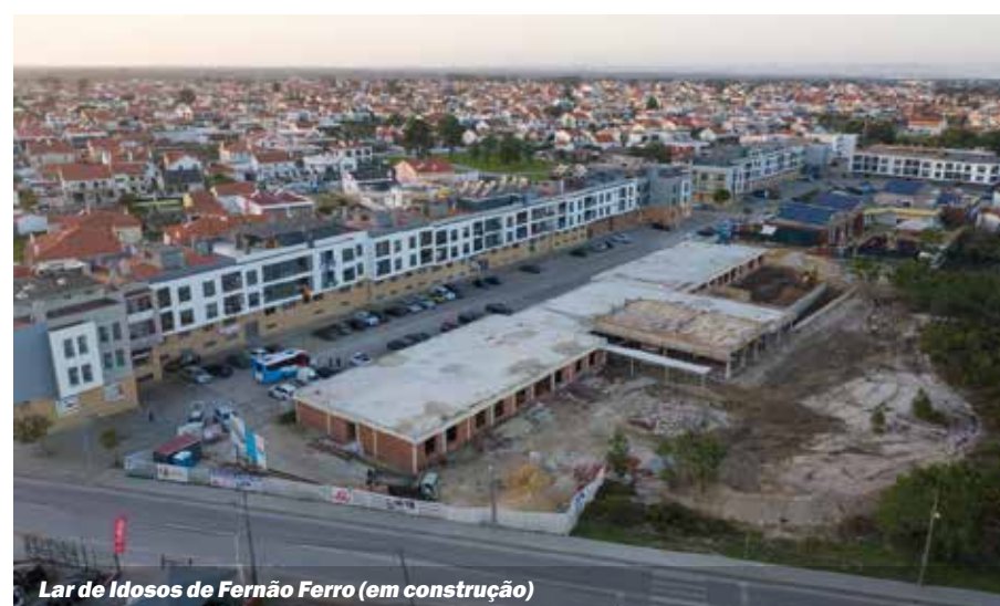
Lar de Idosos de Fernão Ferro (em construção)