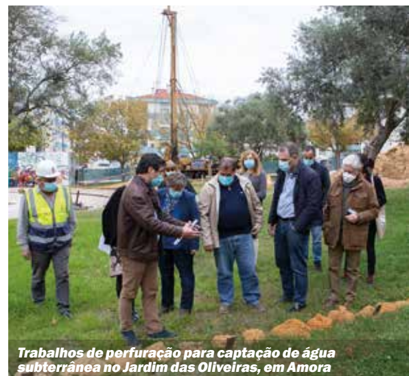
Trabalhos de perfuração para captação de água subterrânea no Jardim das Oliveiras, em Amora

Executivo municipal acompanha intervenções no concelho