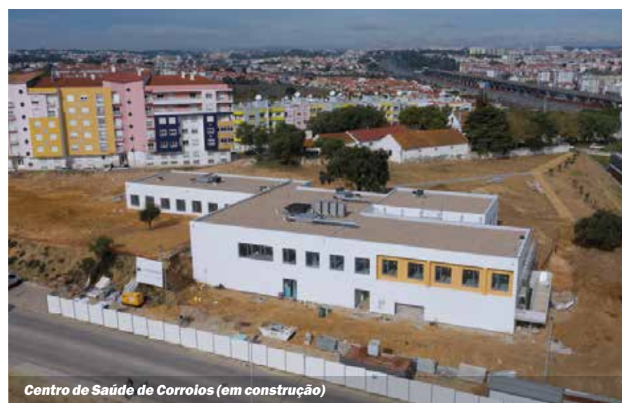
Centro de Saúde de Corroios (em construção)