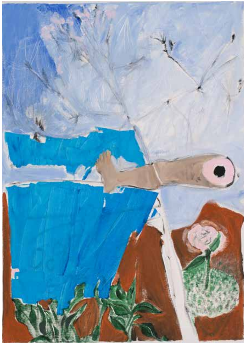
DA SÉRIE BONECAS AUTORRETRATO 4 acrílico e colagem sobre tela, 2026