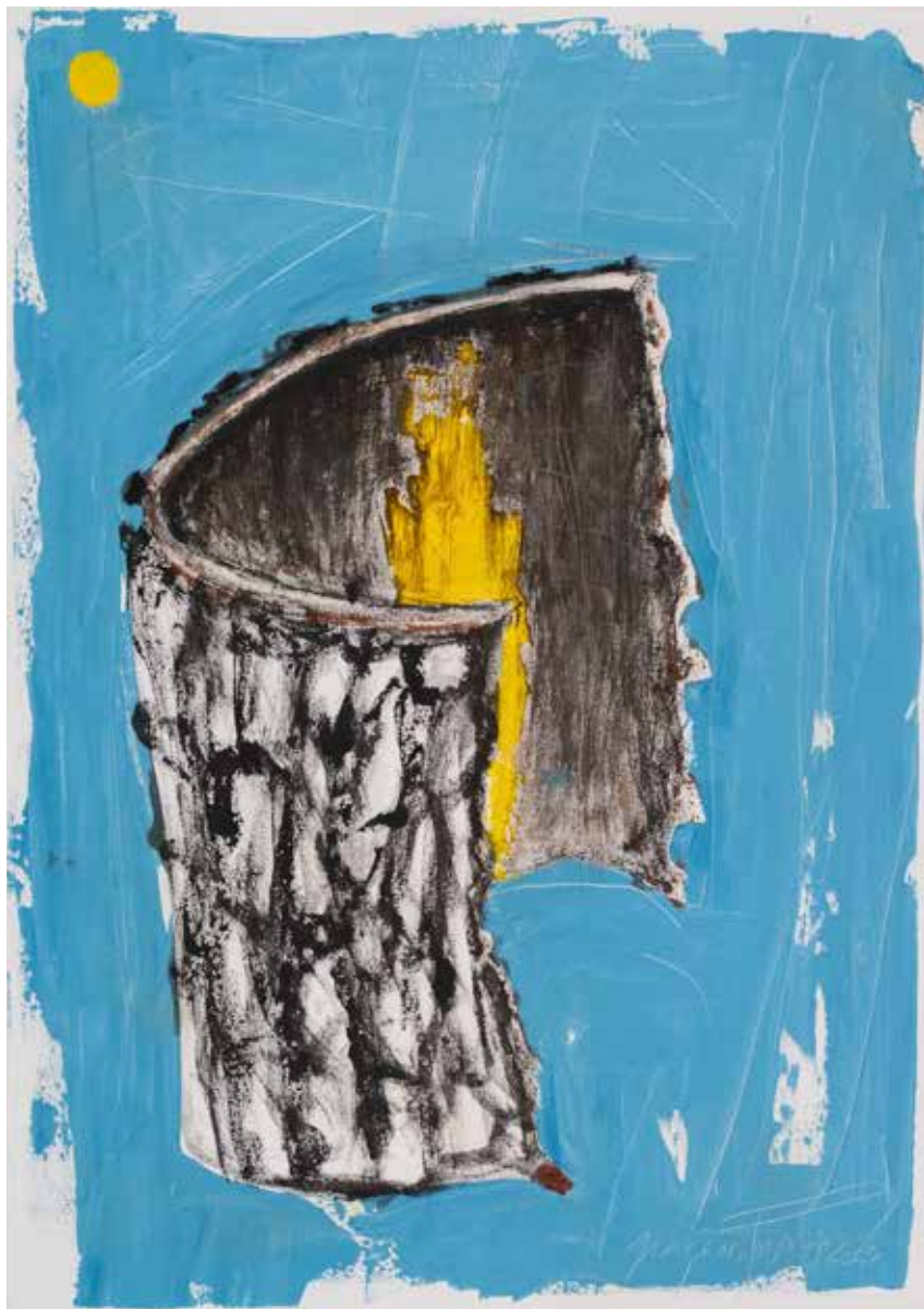
DA SÉRIE BONECAS AUTORRETRATO 17 acrílico e colagem sobre tela, 2026