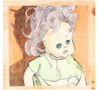
A BONECA DE BORRACHA técnica mista sobre papel e madeira, 4 peças, 2024