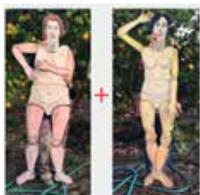
GRAÇA ANTUNES SARA ANTUNES